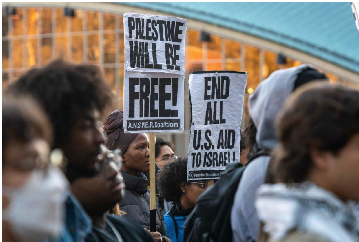
Manifestazione a sostegno della Palestina presso il Massachusetts Institute of Technology, il 19 ottobre 2023.